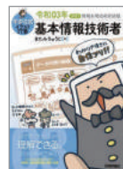
『キタミ式イラストIT塾基本情報技術者』 きたみりゅうじ著 3F就職資格 シユウ/6416