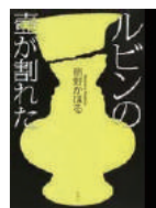
『ルビンの壺が割れた』 宿野かほる著 3F図書 913.6/1366