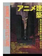
『アニメ建築』 シュテファン・リーケルス著 4F図書 778.77/81