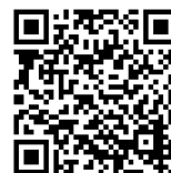
▲LEONET Wi-Fi Webサイト

学内のほぼ全ての施設内がWi-Fi利用可能エリアです。詳細は、情報科学センターWebサイトの「在学生の皆様へ」→「学生生活を支援するサービス」→「Wi-Fi」をご確認ください。教職員の方も、同様の接続方法でご利用いただけます。