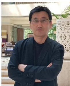
経営学部 商学科 教授