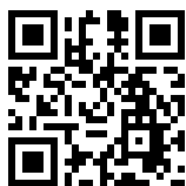
予約アドレス QR コード